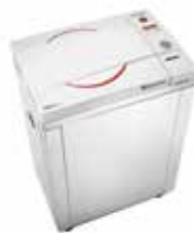
Autoclaves de laboratorio, con cámara horizontal, vertical y volúmenes varios.