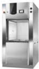
Línea T-Max de esterilizadores grandes

Presentando la gama de soluciones para limpieza, desinfección y esterilización de Tuttnauer