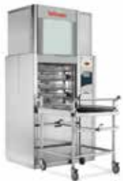
Lavadoras desinfectadoras para hospitales y laboratorios