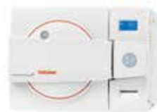
Esterilizadores de mesa pre y post vacío diseñados para ejecutar ciclos de clase B